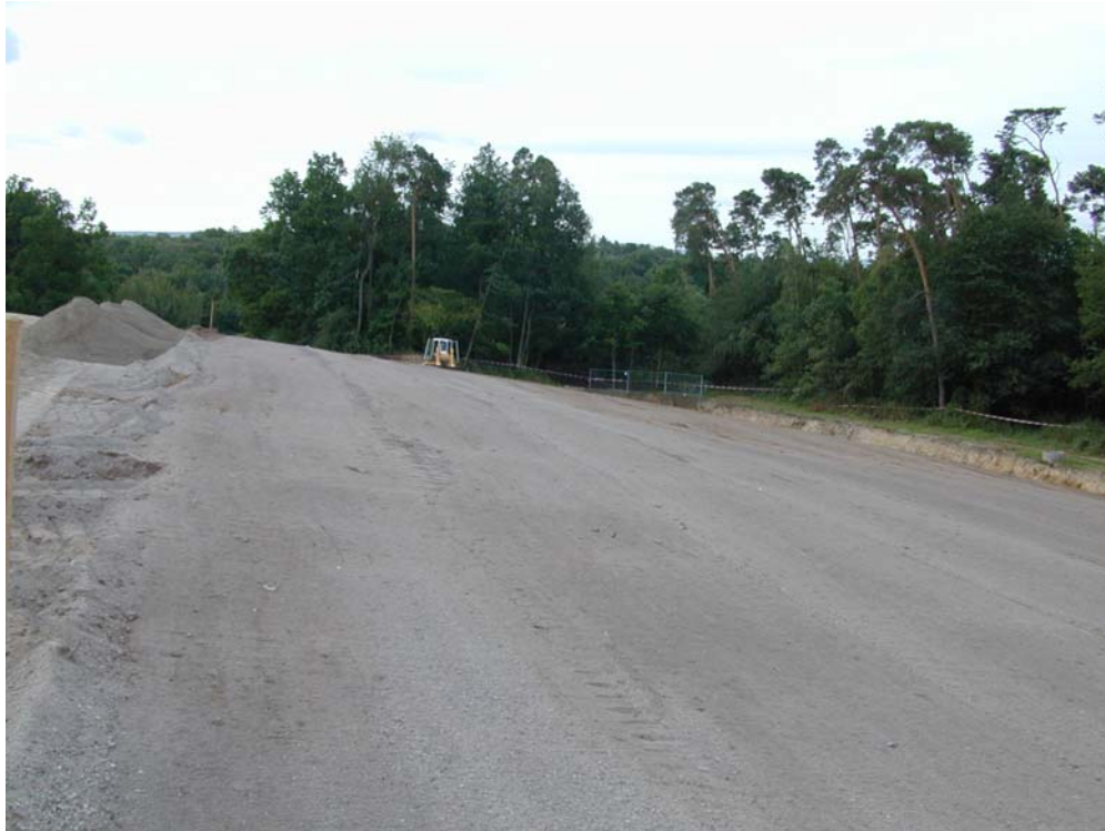
Aufbringen der Ausgleichsschicht (KDB-Auflager) im süd-westlichen Deponiebereich