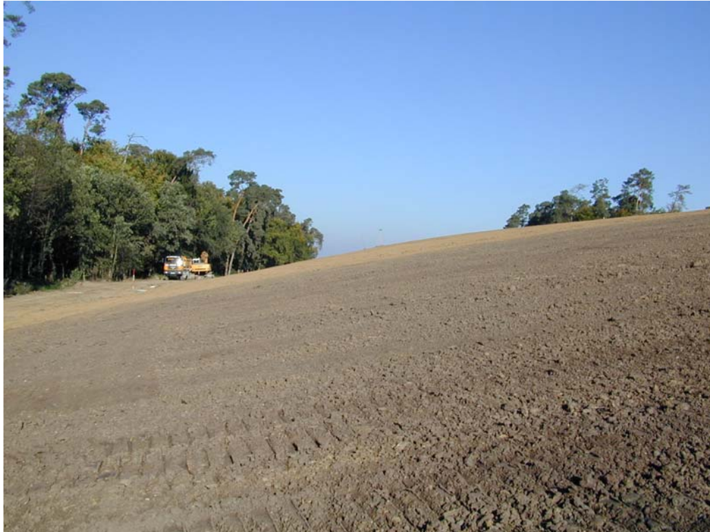
Abgeschlossene Westböschung der Deponie vor der Einsaat