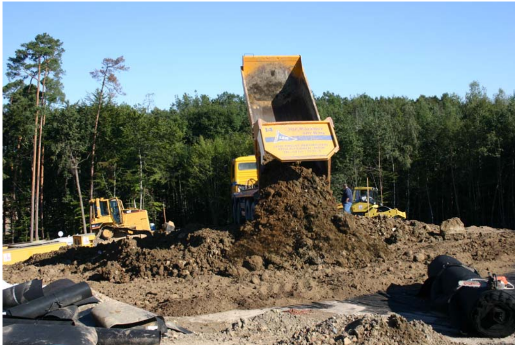
Die 1,70 m starke Rekultivierungsschicht wird aufgebracht