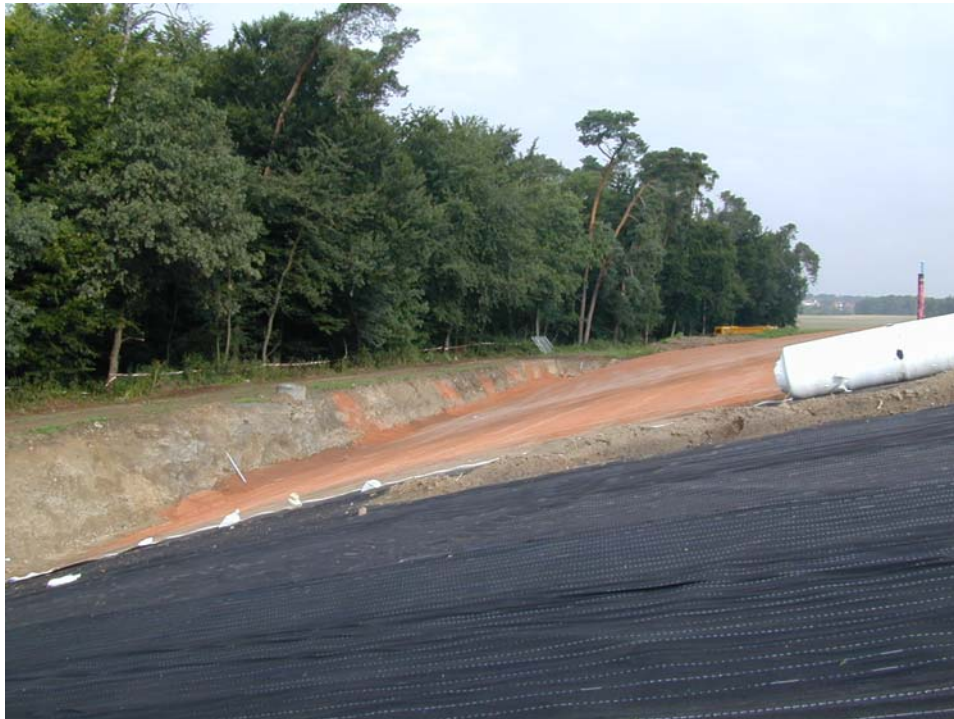
KDB mit Dränvlies im Vordergrund, Ausgleichsschicht im Hintergrund, an der Deponiewestflanke