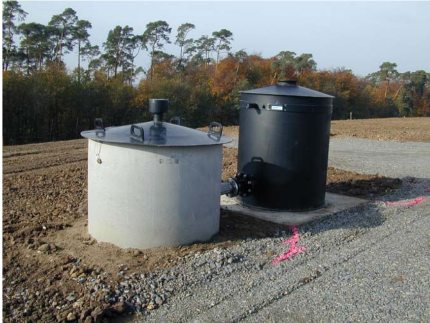
Passives Entgasungssystem mit Biofilter