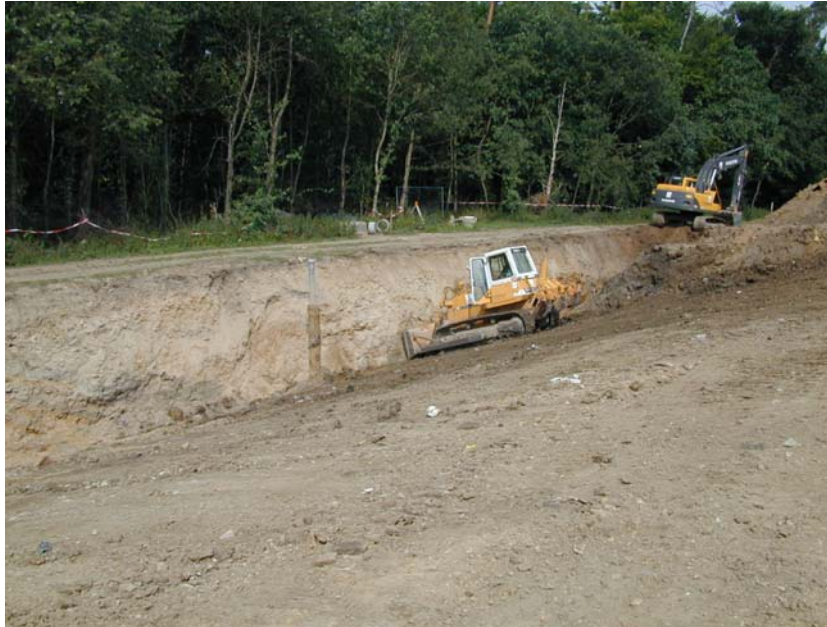
Einbindegraben an der Westseite der Deponie