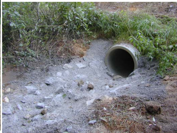
Durchlass (Einlauf und Auslass) beim Neudorfer Graben