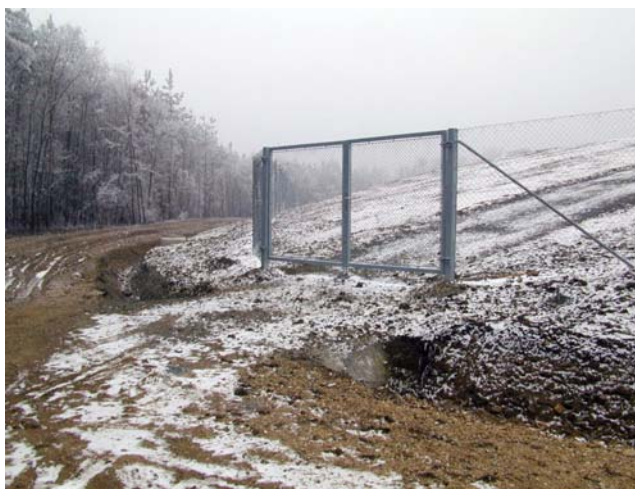
Sicherung durch Umzäunung

Hausanschrift isu umweltinstitut GmbH Sanderstraße 23-25 97070 Würzburg