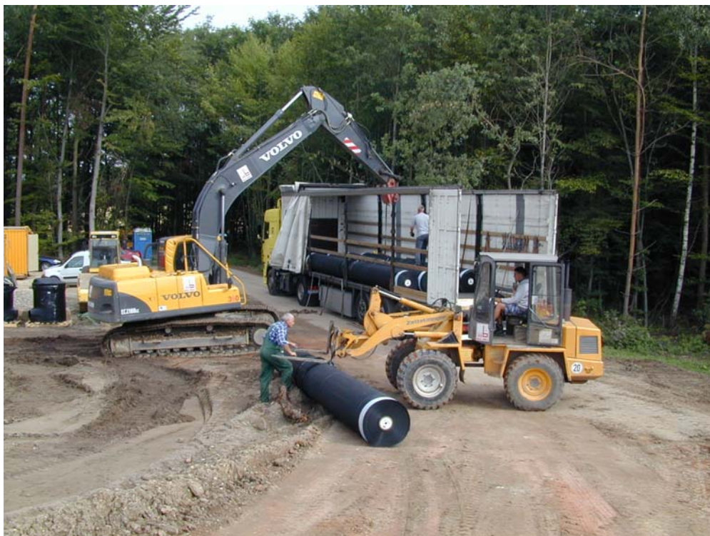
Anlieferung der KDB-Rollen

Hausanschrift isu umweltinstitut GmbH Sanderstraße 23-25 97070 Würzburg