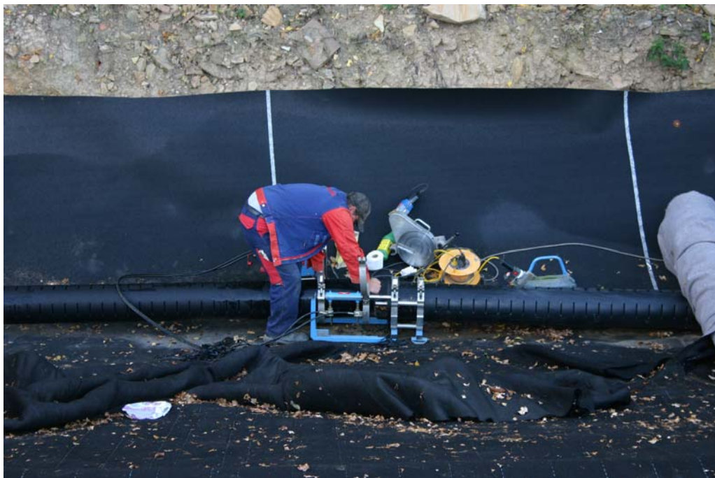
Schweißarbeiten an den PE-Rohrleitungen der Ringdränage