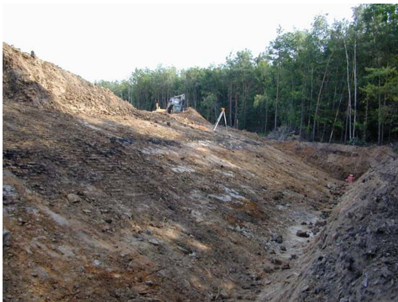
Erstellung des Einbindegrabens im süd-östlichen Deponierandbereich

Hausanschrift isu umweltinstitut GmbH Sanderstraße 23-25 97070 Würzburg