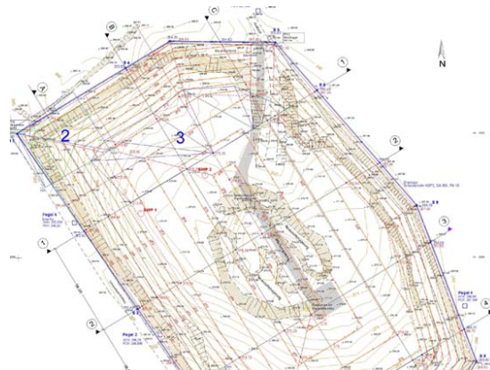
Entwurfsplanung, Juni 2004

Errichtung weiterer Grundwassermessstellen, Ende Juni 2004